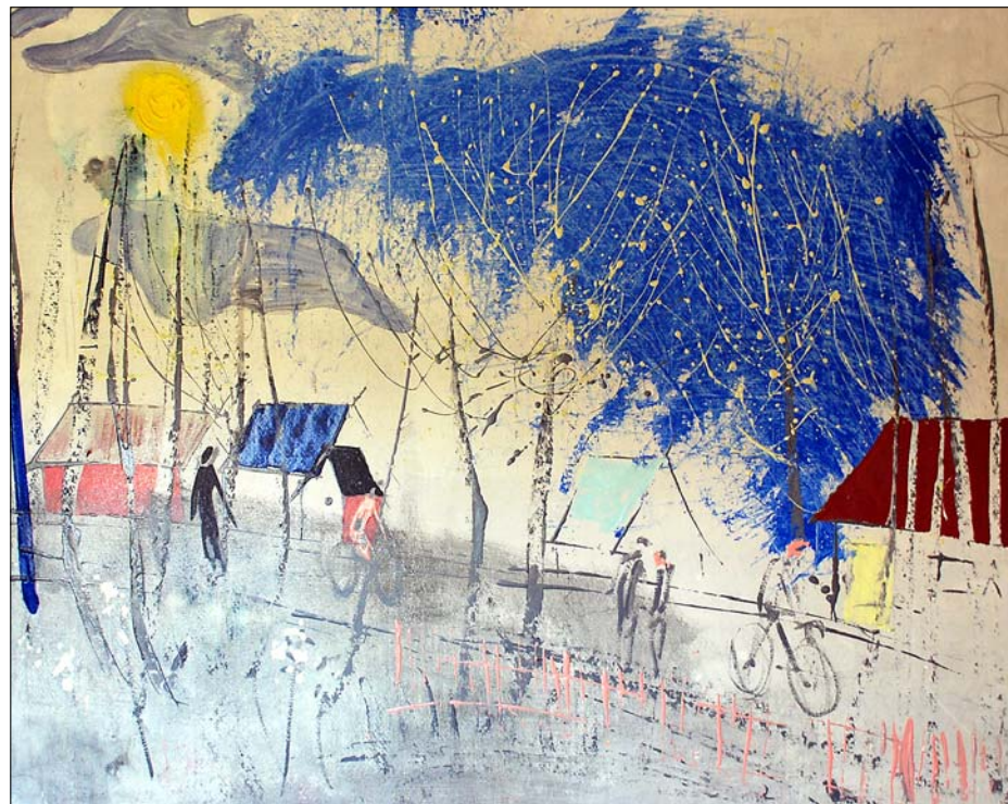
J. Pauļuks. Zilā Jelgava

Vizuālo darbu nodaļai 2008. gadā bija labi rezultāti — vizuālo darbu autori par savu darbu izmantošanu saņēma Ls 42 370, kas ir par Ls 14 928 vairāk nekā 2007. gadā, tai skaitā par savu darbu reproducēšanu izdevniecībās (žurnālos, grāmatās, avīzēs) — Ls 8 588, raidīšanu televīzijā — Ls 2 151, kabeļtelevīzijā — 10 672, par darbu izmantošanu valsts un kultūras organizācijās — Ls 380, atbildību par tālāk-pārdošanu — Ls 20 579.