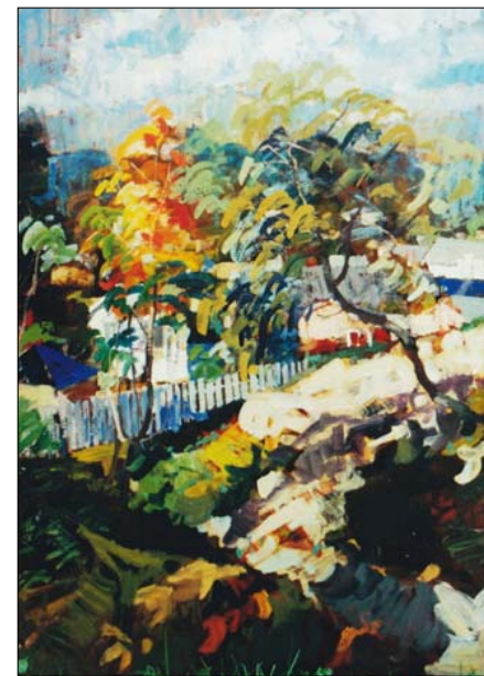
J.Pauļuks. Vasarņīcas nostūris