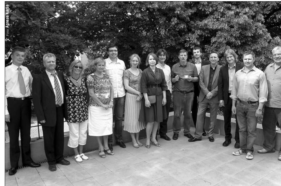
Autoru biedrību darbinieki no Latvijas, Lietuvas, Igaunijas un Lielbritānijas dalās pieredzē par darbu interneta vidē

Interneta vide un dažādu autoru darbu izmantošana tajā ir salīdzinoši jauna, tādēļ šobrīd aktīvi tiek domāts gan par efektīvāko autortiesību administrēšanas veidu, gan par sabiedrības informēšanu par šiem jautājumiem. Lai rastu labāko risinājumu un mācītos no pieredzējušāko organizāciju pieredzes, AKKA/LAA organizēja Baltijas semināru par autoru darbu izmantošanu internetā.