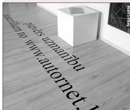
Selgas Lapiņas izstādē "Šņore" galvenā uzmanība veltīta autortiesību aizsardzībai