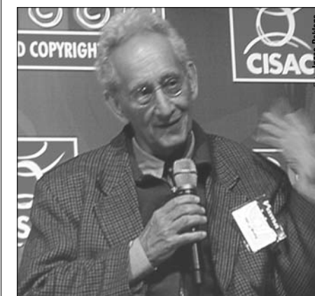
Gleznotājs un tēlnieks Franks Stella (ASV) autortiesību samītā runā par mākslas darbu tālākpārdošanu

2009.gada 6.februāra tiesas sēdē un tiesas lēmums par izlīguma apstiprināšanu spēkā stājās 2009.gada 16.februārī. Pamatojoties uz AKKA/LAA lūgumu un starp pusēm noslēgto izlīgumu, Latvijas Republikas Iekšlietu ministrijas Valsts policijas Galvenās Kriminālpolicijas pārvaldes