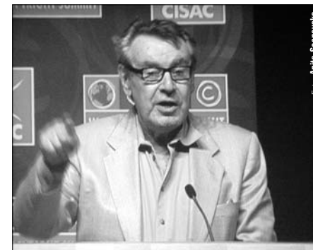
Kinorežisors Milošs Formans Pasaules autortiesību samitā

2008. gadā tirgu pameta vairāki satura nodrošinātāji, kuri piedāvāja mobilo telefonu zvanu melodijas